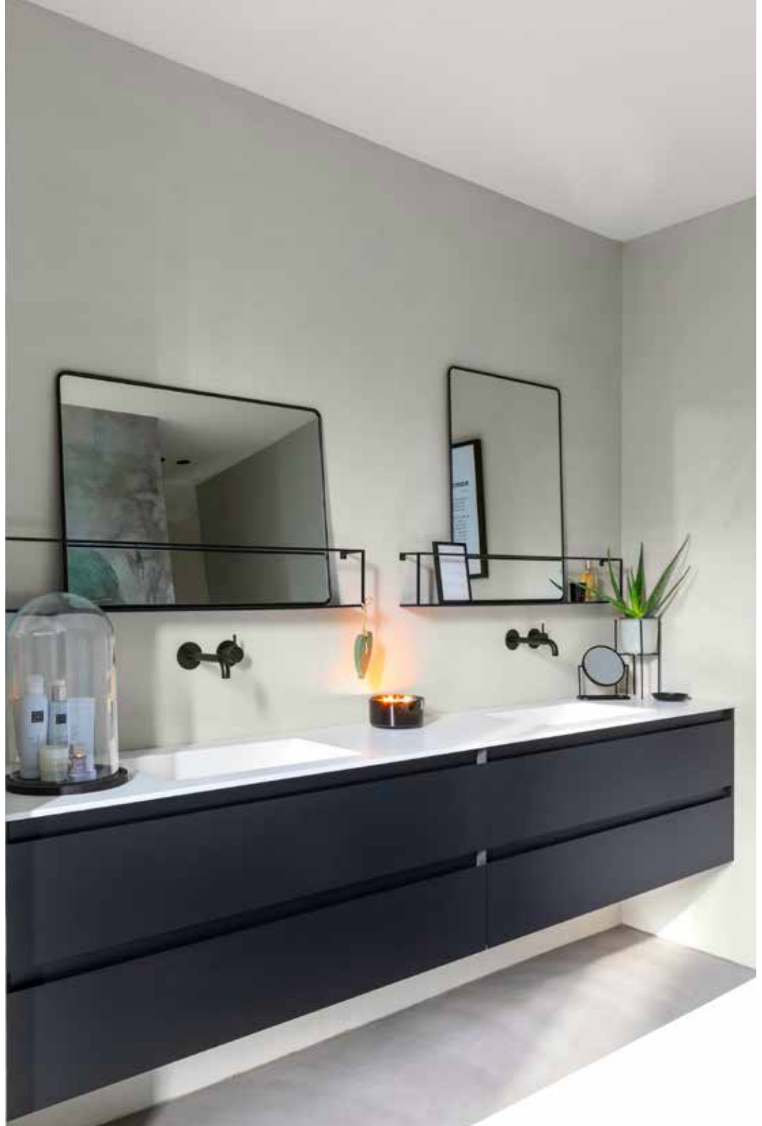
In de badkamer is voor de vloer en muren Microcement gebruikt (via Van Hollandse Bodem uit Gorinchem). Het sanitair komt van Sanisale in Alphen aan de Rijn (meubel Bliss Elements is van Sanibell) en is geplaatst door KDB Onderhoudsbedrijf uit Zoetermeer. De kranen zijn van het merk Hotbath.

“IK ORGANISEERDE REGELMATIG WEEKENDJES EN BOEKTE DAN EEN HOTEL IN DE BUURT VAN LEUKE WOONWINKELS”