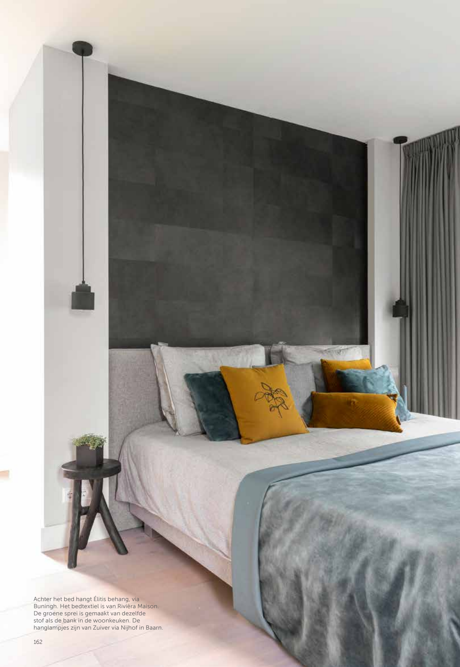
Achter het bed hangt Élitis behang, via Buningh. Het bedtextiel is van Riviera Maison. De groene sprei is gemaakt van dezelfde stof als de bank in de woonkeuken. De hanglampjes zijn van Zuiver via Nijhof in Baarn.